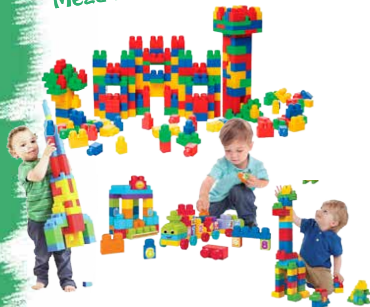
Mega Bloks Zone

2h, avec comédien costumé, et moquette gazon.