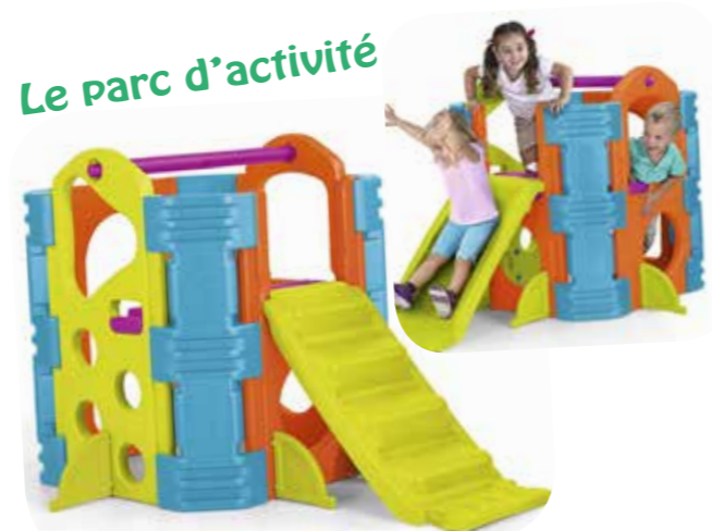
Le parc d'activité

2h, avec comédien costumé, et moquette gazon.